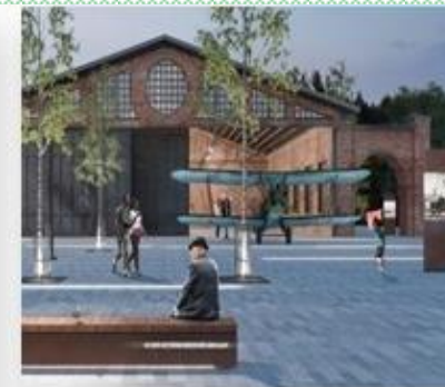
«Аэропарк» - 61,0 млн. руб.