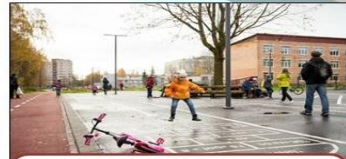
Строительство и реконструкция улично-дорожной сети (в т.ч. ПСД) 20,6 млн. руб.