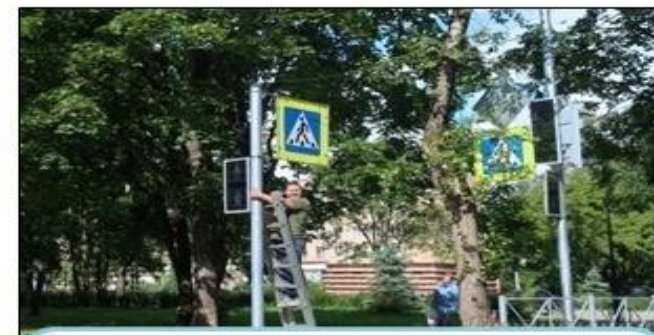
Безопасность дорожного движения 12,5 млн. руб.