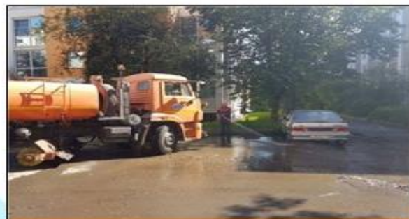
Содержание, ремонт и уборка дорог, дворов и территорий общего пользования 209,8 млн. руб.