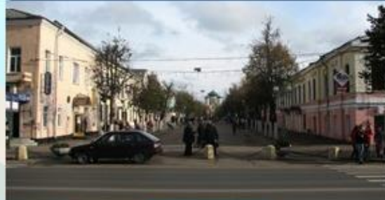
Благоустройство дворовых территорий – 3,0 млн. руб.