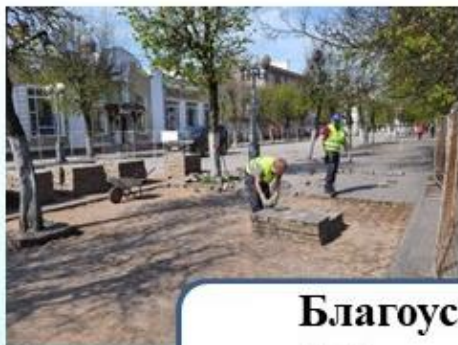
Благоустройство ул. Соборной 4-й этап – 54,0 млн. руб.