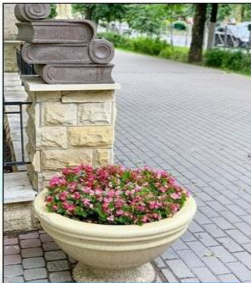
Благоустройство территории 121,7 млн. руб.