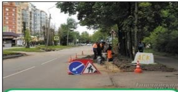
Ремонт дорог, тротуаров, дворов 47,2 млн. руб.